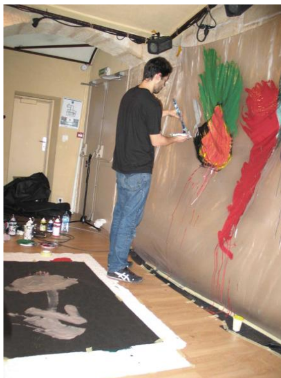
Peinture d'une figue pour Isabel.