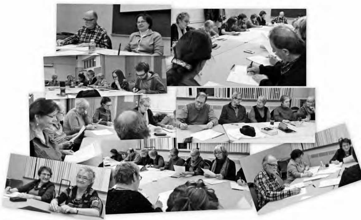
Le groupe de poètes de haïku, à Québec, en plein travail d'écriture