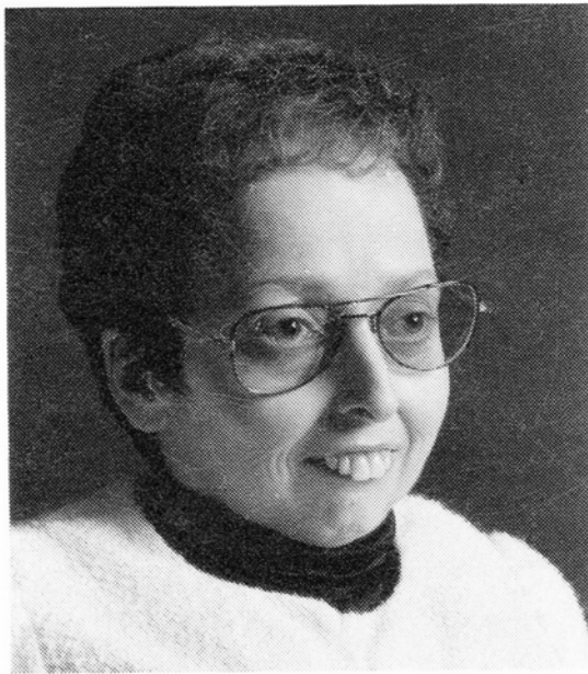
Photographe non mentionné. Photo prise vers 1985